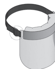
Abb. 1 COVID Shield Pro